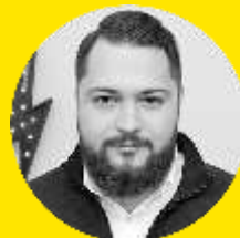
ЕВГЕНИЙ ШЕСТАКОВ Rush Agency