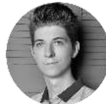
ЕВГЕНИЙ КОСТИН SeoPult